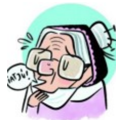
QUITÁRSELA PARA TOSER O ESTORNUDAR