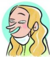
PONÉRSELA DE BUFANDA