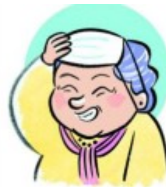
PONÉRSELA DE SOMBRERO