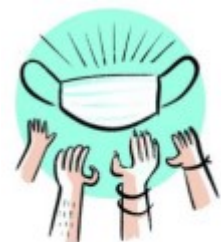
COMPARTIR LA MISMA VARIAS PERSONAS