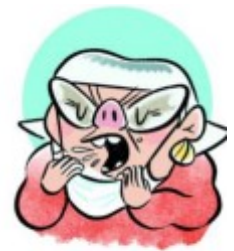
QUITÁRSELA PARA HABLAR